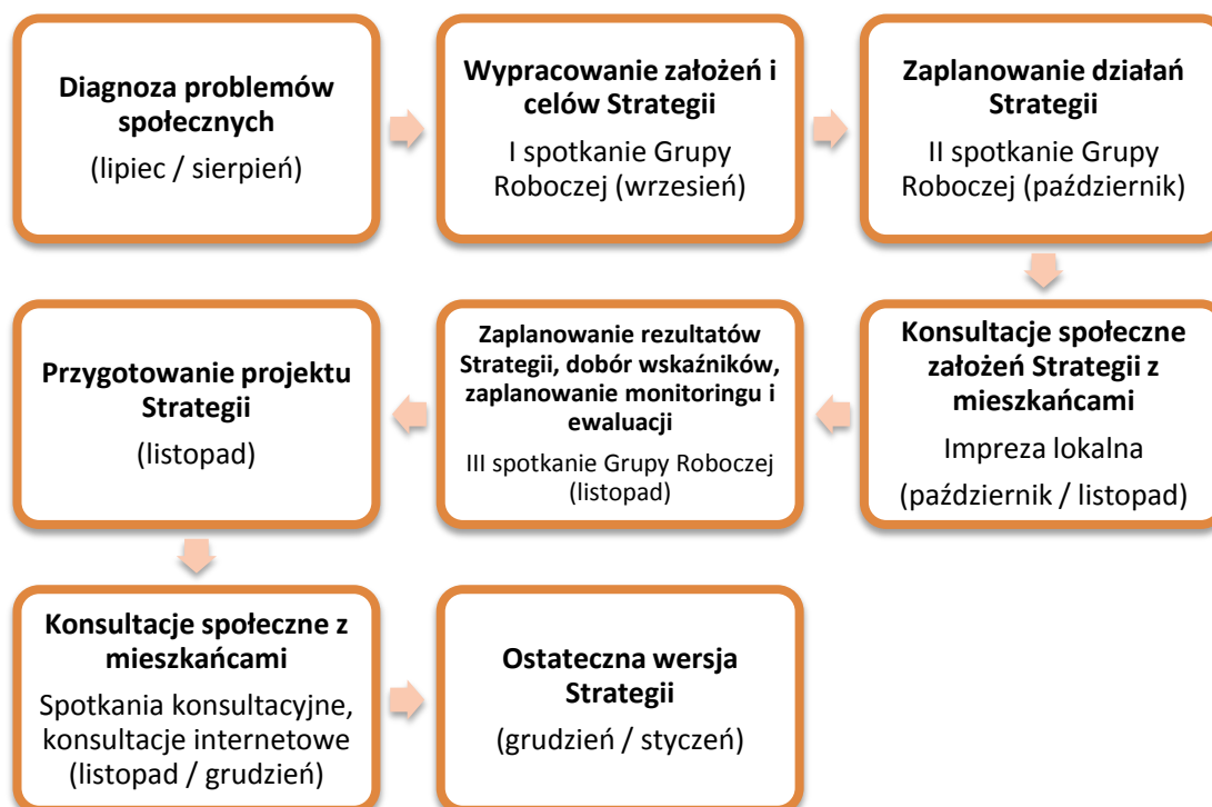
RYSUNEK 1. STRATEGIA INTEGRACJI I ROZWIĄZYWANIA PROBLEMÓW SPOŁECZNYCH W GMINIE LIBIĄŻ – ETAPY TWORZENIA.

W procesie tworzenia Strategii Integracji i Rozwiązywania Problemów Społecznych w Gminie Libiąż na lata 2014 – 2020 uczestniczyli przedstawiciele samorządu lokalnego, środowisk pomocy społecznej, rynku pracy, oświaty, ochrony zdrowia, policji, przedstawiciele organizacji pozarządowych, mieszkańcy gminy oraz eksperci.